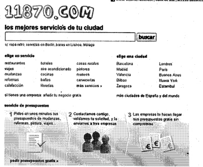
Imagen del buscador de negocios locales de la web 11870.com.

"Los internautas saben discernir qué comentarios son sinceros y cuáles son mero marketing"